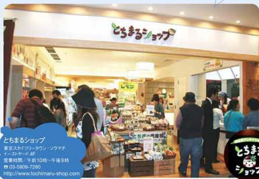
とちまるショップ 東京スカイツリータウン・ソラマチ イーストヤード 4F 営業時間 / 午前10時～午後9時 ☎ 03-5800-7280 http://www.tochimaru-shop.com

5月22日に開業した「東京スカイツリータウン」とは、東京スカイツリーや、周辺施設全体の総称です。その中にある商業施設「東京ソラマチ」に、栃木県の物産を販売する「とちまるショップ」もオープンしました。