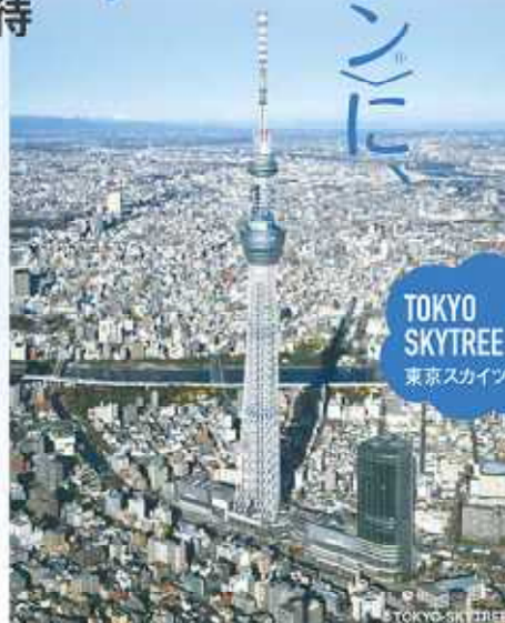
TOKYO SKYTREE 東京スカイツリー