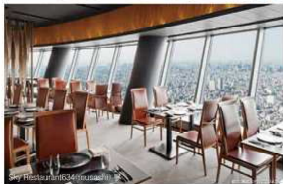
Sky Restaurant R34 (mussashi)