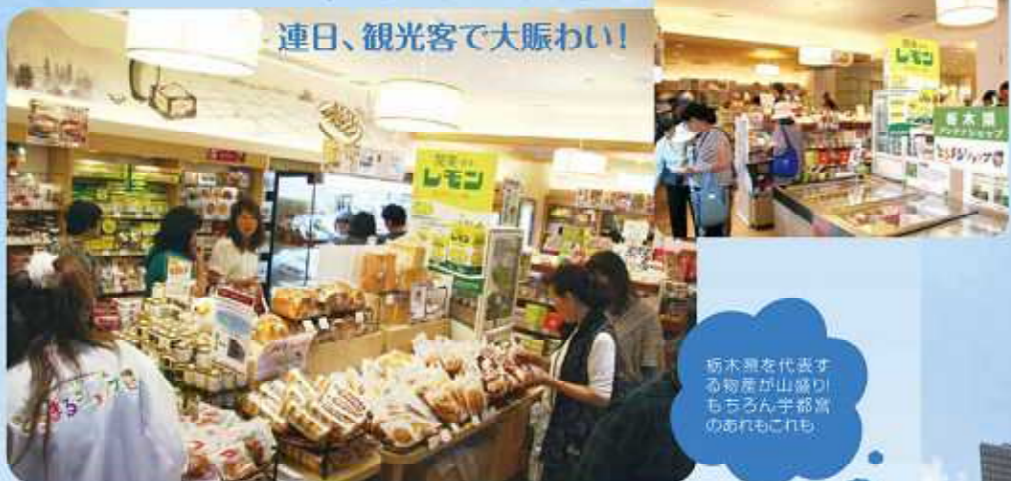
栃木県を代表する物産が山盛り とちまるショップのあれもこれも

出店の狙いは、①本県・市町村の知名度アップ、ブランド力向上 ②地域食品産業等の振興 ③本県への誘客促進を目的に、「とちぎ」の魅力を丸ごと伝え、「とちぎ」を楽しんでもらう」としています。(平成23年5月、栃木県「栃木県アンテナショップ基本計画」より)。 東京スカイツリータウンの開業による本県への経済効果は、観光入込数で250万人、宿泊数で24万人、旅行消費額は297億円と試算されています(あしきん総合研究所調べ)。 その通りの効果が実現すれば、最近さまざまな理由でもすれば元気がなくなっている栃木県内の観光地にとって、大きな福音となることでしよう。 管理運営をまかされているのは、「ろまんちっく村」の指定管理者として実績を積んできた、㈱ファーマー