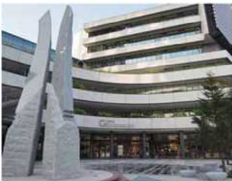
東京スカイツリータウン 所在地 / 東京都墨田区押上 1-1-2 敷地面積 / 約 36,900㎡ 主な施設 / 電波塔、展望台、商業施設(東京ソラマチ)、プラネタリウム、水族館、オフィスなど

ズ・フォレスト。同社の松本謙社長は、新聞取材に答えて「民間が運営を請け負うからには他店に負けない。わくわく感のあるお店にしたい」(産経新聞5月1日付)と抱負を語っています。「ご当地感を出さないと市場競争に負けてしまう。『おしゃれなんだけど、この辺が栃木』。そんな栃木らしさが必要です」(同)との言葉に、期待が高まります。 物産だけでなく、各地の観光パンフレットもそろえ、文字通り「とちぎの情報発信基地」の役割も担う「とちまるショップ」。県外の知人に、ぜひお勧めしてください。