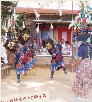
関白山神社境内での獅子舞

方、各地より獅子舞伝授の要望もあった。塩谷町船生寺小路には、文化七(一八一〇)年に関白村よりの獅子舞伝授書が、宇都宮市中里西組、同横倉には天保九年の伝授書等があり伝授の様子が窺える。